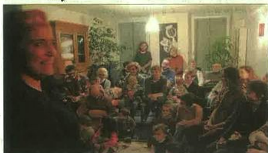
■ Près de quarante personnes ont assisté à la première, mardi.

Le spectacle se poursuit ce jeudi, mais aussi vendredi et samedi, chaque jour à 16 h 30. Le tarif adulte et enfant est unique, à 6 €. Les représentations sont ouvertes à tous dès un an, dans la limite des places disponibles. Adresse : 14, rue Paul-Bonhomme, à Millau. Réservation conseillée au 06 07 73 30 84. Plus d'informations sur envotrecompagnie.wifeo.com .