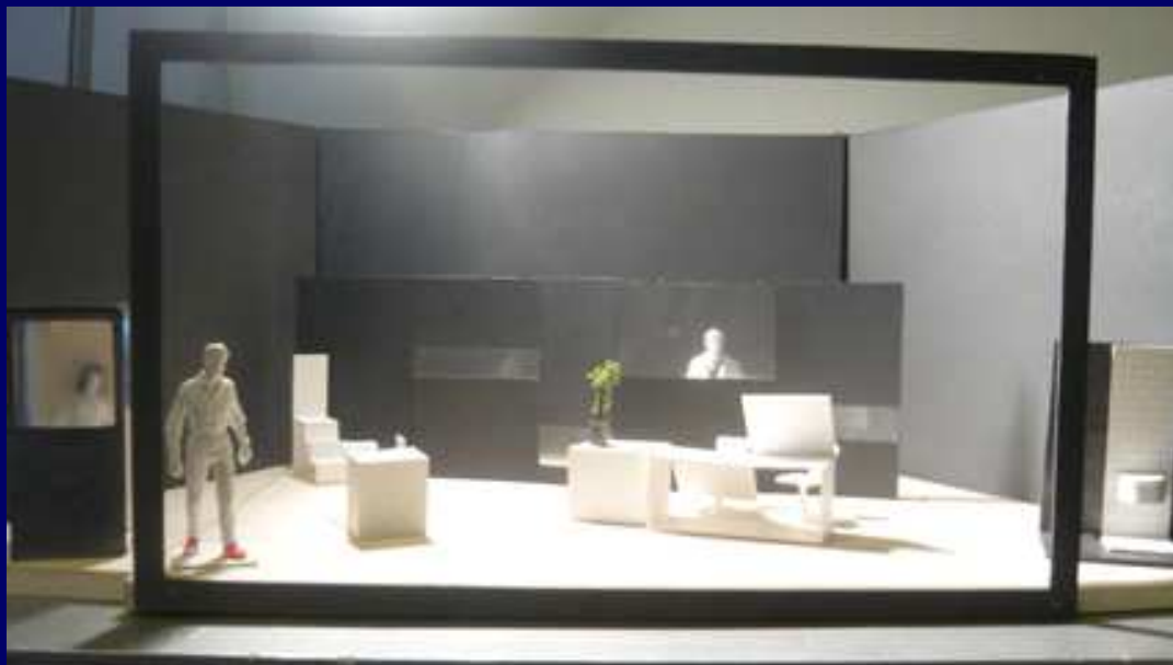
Maquette Décor Building